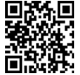
フィーチャーフォン