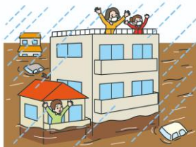
③近隣の高い建物等への移動