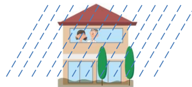
④建物内の2階等の安全な場所での待避