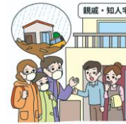
②安全な場所への移動 (近くの親戚や友人の家等)