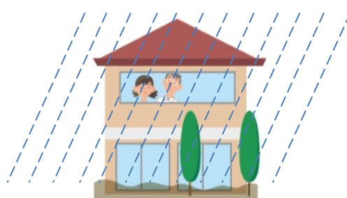
④ 建物内の安全な場所での待避(2階等)