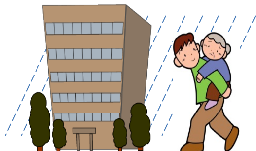
③ 近隣の高い建物等への移動