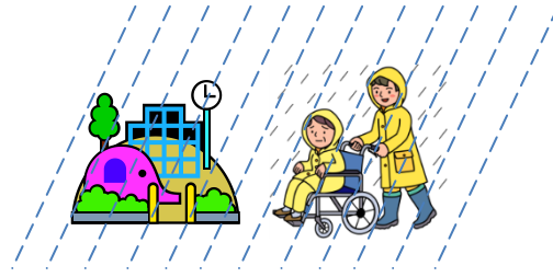
② 安全な場所への移動 (親戚や友人の家等)